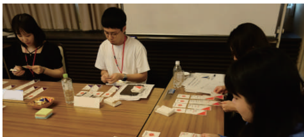
2023年9月(合宿・京都市) キャリア自律ワークショップ

自身のキャリアにおいて大切にしていることの棚おろしをします。自分としっかり向き合い、ビジネスリーダーとなるための研鑽を積みます。