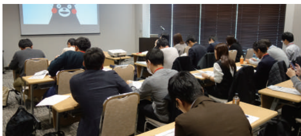
2023年12月(最終合宿・熊本県) くまもとセミコンテクノパークを訪問

現地・現場への訪問やゲスト講師を迎えるなど、人事や事業の担当者から直接話を聴くことで、「類推する力」を鍛えます。