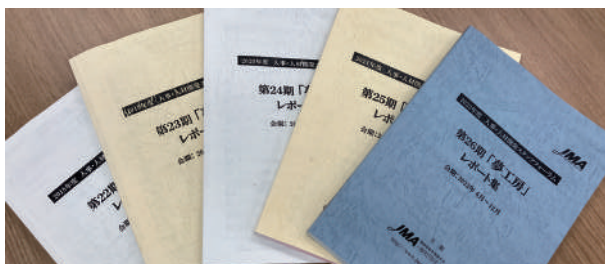
参加者の課題レポートはレポート集としてまとめます

必読書、課題レポートに繰り返し取り組むことで、時間を捻出してやり遂げる力、発信力、論理構築力を短期間で身につけます。